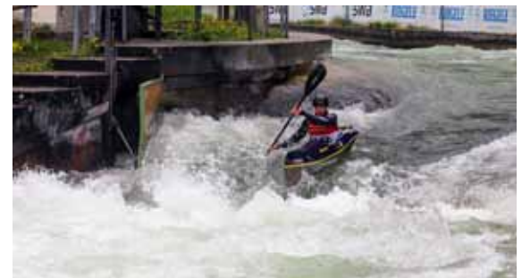
Nervenkitzel pur: Wildwasserabfahrten.