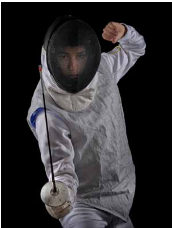
Gelhausen setzt Amateursportler in Szene.