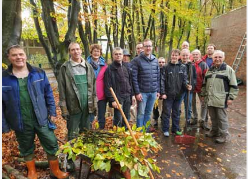
Auch im letzten Jahr fanden sich viele helfende Hände, um das Gelände rund ums Bootshaus frühlingsfit zu machen.