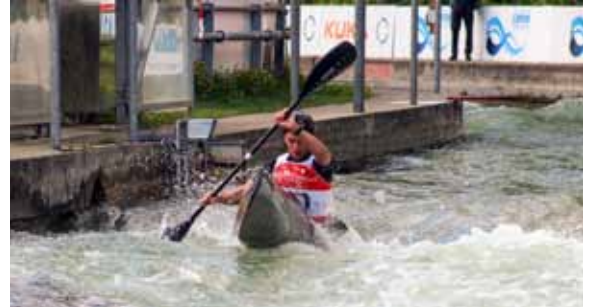
Auch in diesem Jahr stehen viele Veranstaltungen im Wildwasserrennsport auf dem Plan.

Wir wünschen allen Sportlern für 2020 viel Erfolg und reichen Lohn für hartes Training.