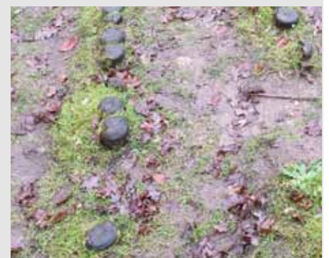
Die Pfütze am Bootshaus (oben) und die maroden Holzpalisaden (unten).