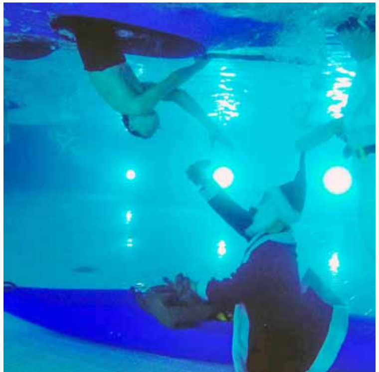
Ein Weihnachtsmann unter Wasser: Beim Weihnachtskenten geht es nicht ohne ihn.

Die gute Kooperation zwischen der Tauchsportgruppe Ahrensburg und den Kanuten von Oberalster V.f.W. verlief wieder hervorragend. Wie im vergangenen Jahr schon wechselte auch dieses Mal der tauchende Weihnachtsmann das Becken von den Tauchern zu den Kanuten ins Wellenbecken. So durften alle einmal zum Weihnachtsmann „abtauchen“ und haben ein Säckchen bekommen. Im Anschluss sind die Teilnehmer mit oder ohne Hilfe hochgerollt. Für alle war es wieder ein tolles Erlebnis und besonders die Kinder freuten sich über ihr kleines Weihnachtsgeschenk. Schon jetzt planen wir das nächste Weihnachtskenten und hoffen das alles wieder so gut klappt. Danke an den Mann in Rot. (ich glaube der Name ist Santa Klaus...)