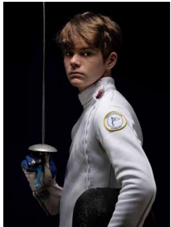
Professionelle Sportfotos für Zuhause.