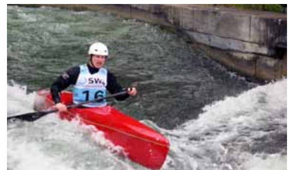
Das Wintertraining soll sich auszahlen.