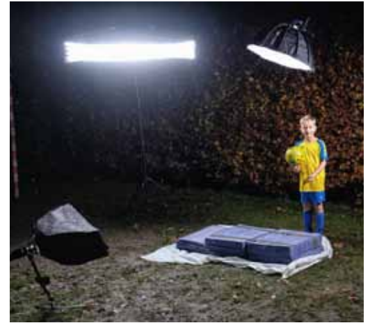
Fotoshooting im heimischen Garten.