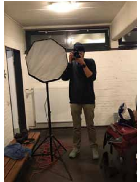
Auch eine Umkleidekabine kann zum Fotostudio werden.