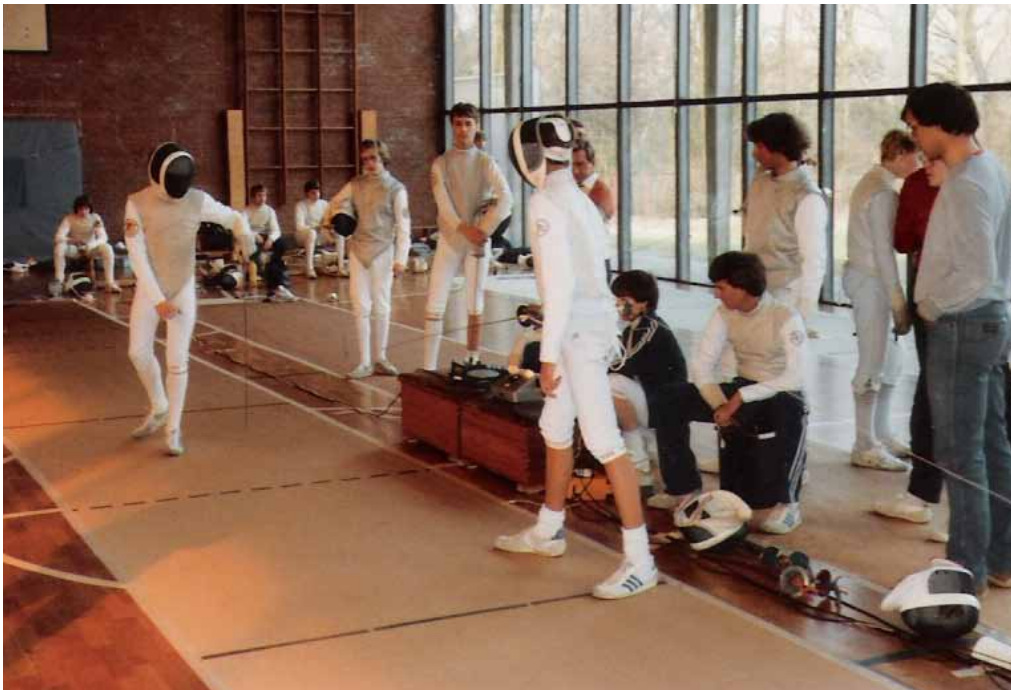
1984- 25-jähriges Jubiläum Das Turnier in der Sporthalle des Albert-Schweitzer Gymnasiums.

Wir sind zuversichtlich, dass unser Verein auch die nächsten Jahrzehnte eine sportlich erfolgreiche Zukunft vor sich hat. Wir freuen uns über alle, die uns auf diesem Weg begleiten.