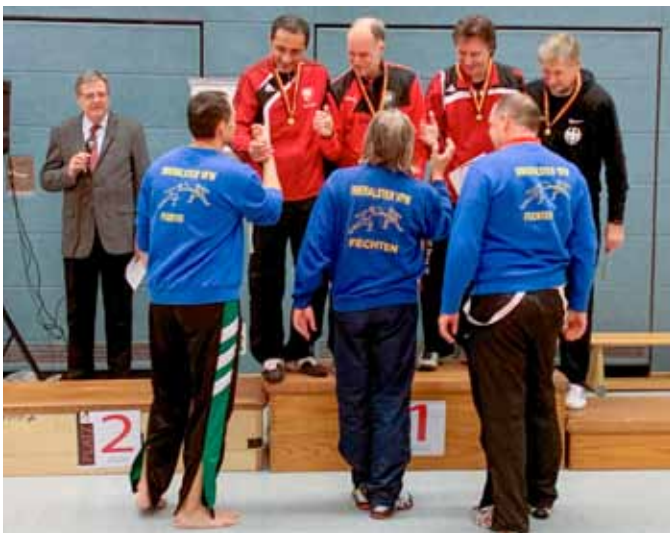
Gratulation für den Sieger.

Wir hatten zwar in den einzelnen Gefechten unsere Chancen, aber die knappen Gefechte gingen leider zu unseren Ungunsten aus, so dass wir nur zweimal gewinnen konnten bevor unsere Gegner den fünften Sieg machten. Die Duisburger konnten erneut den Titel mit nach Hause nehmen; deren Serie ist mittlerweile bemerkenswert.