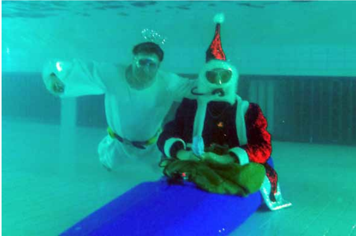
Ein Weihnachtsmann im Kanu und sein Helfer.

Traditionell am zweiten Freitag im Dezember war es mal wieder so weit: Es ging in diesem Jahr mit 30 Kanuten ins Badlantic nach Ahrensburg zum Weihnachtskenten.